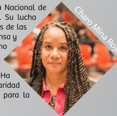
Charo Mina Rojas

Es activista, lideresa indígena y Consejera de Derechos Humanos y Paz de la Organización Nacional Indígena de Colombia (ONIC). Su lucha se ha enfocado en reconstruir el pensamiento indígena y hacer valer los derechos de su pueblo golpeado por el conflicto. Su historia es de resistencia y valentía. Desde pequeña ha sido testigo de abusos contra su comunidad y desde allí optó por defender los derechos de los suyos, expulsando a los actores armados del conflicto y ganándose el respeto de su comunidad. En 2007 se convirtió en la primera mujer indígena en ocupar el cargo de consejera mayor del Consejo Regional Indígena del Cauca (CRIC). En 2008 su esposo fue asesinado y ella amenazada, por lo que tuvo que optar por protegerse. Ha formado parte de la mesa de diálogo de La Habana y su voz es clave para comprender los desafíos que enfrenta Colombia tras la Firma Final del Acuerdo de Paz.